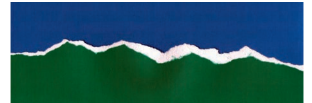
untitled | 2015 Druck und Papier 10 x 30 cm