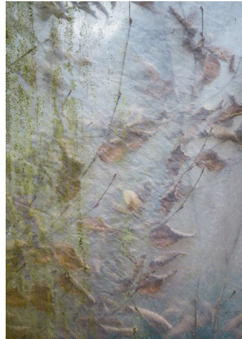
Durchsicht I | 2015 Fotografie / HD Metal Prints 60 x 40 cm

Barbara Donaubauer arbeitet mit rein natürlichen Lichtverhältnissen. Farben und Licht geben eine winterliche Atmosphäre wieder. Die bildverfremdende Wirkung durch den Filter evoziert einen Grad der Abstraktion, der beim Betrachter vielfältige Assoziationen abrufft.